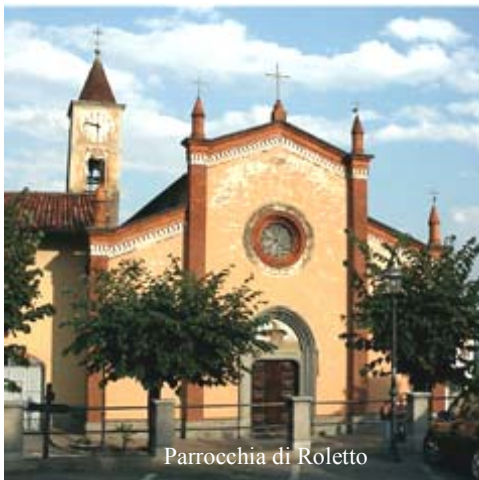
Parrocchia di Roletto

nato a Pietraporzio nella valle della Stura di Demonte nelle montagne cuneesi. Non ci stupisce il fatto che un cuneese fosse parroco a Roletto.