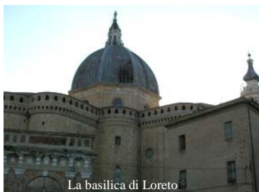
La basilica di Loreto

La Casa è al centro della basilica, tardogotica e rinascimentale, in cui oggi come in passato milioni di fedeli, attratti dalla natura del luogo e dalla bellezza artistica, così atta ad indicare la Bellezza antica e sempre nuova, cercano il Signore e lo incontrano nella Parola e nei sacramenti della Riconciliazione e dell'Eucaristia (“Per Mariam ad Christum”), attingendo forza per il loro cammino fra le persecuzioni del mondo e le consolazioni di Dio. Tanti artisti insigni accompagnano la pietà dei fedeli nel complesso del Santuario, ad esempio Giuliano da Maiano e Baccio Pontelli per il carattere di fortezza della parte absidale, a difesa da possibili attacchi dal mare; Giuliano da Sangallo e Francesco di Giorgio Martini per la cupola, nello stile brunelleschiano del Duomo di Firenze; Melozzo da Forlì per la sacrestia di S. Marco; Luca Signorelli per la Sacrestia di S. Giovanni Evangelista; Luigi Vanvitelli per il campanile, modellato sul borrominiano campanile di S. Andrea delle Fratte a Roma. La ba-