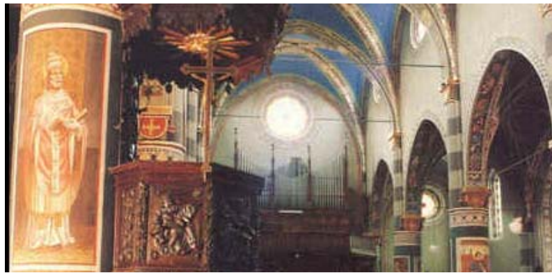
Il duomo, interno