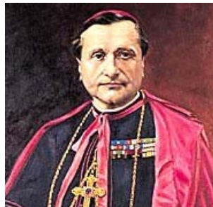
Mons. Angelo Bartolomasi

buoni amministratori - ed una componente critica verso il regime, che si ritrovava nel Partito Popolare e nell'Azione cattolica. Le direttrici del suo ministero episcopale furono la restaurazione del regno di Dio nelle anime e nella società, la pace sociale cristiana e il pieno lealismo e la collaborazione con le autorità costituite, coerentemente con l'impostazione del pontificato di Pio XI - "Pax Christi in regno Christi" -, in cui la Chiesa deve essere attiva nella società e non essere esclusa, come vorrebbe il laicismo liberale.