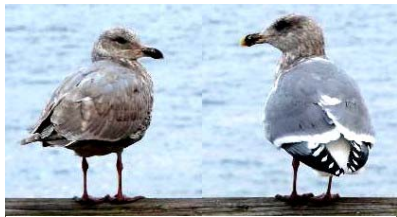
Time for a chat?