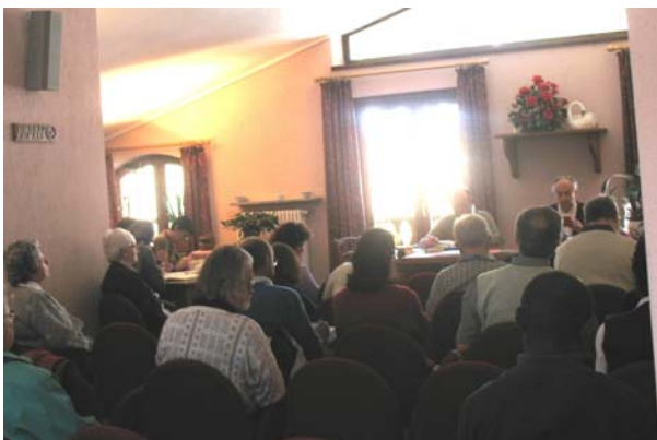
Partecipanti alla Settimana Biblica 2007 a Casalpina di Pragelato

A metà settimana si sono visitate le borgate di Usseaux e di Balboutet alla scoperta delle meridiane e dei murales.