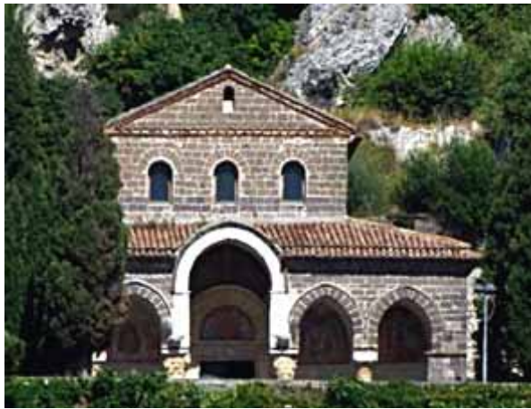
L'abbazia di Sant'Angelo in Formis

custodire il luogo sacro cristiano da possibili reviviscenze di paganesimo - si pensi che ancora nel 942 il papa rimprovera il vescovo di Capua perché in città si celebrano riti in onore di Diana.