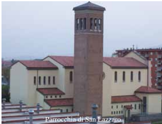
Parrocchia di San Lazzaro

Fu così che lo sconosciuto san Neopolo venne ribattezzato san Napoleone. E per far felice del tutto il Bonaparte, si stabilì che la festa del nuovo santo fosse celebrata il 15 agosto, giorno natale dell'imperatore francese. Con