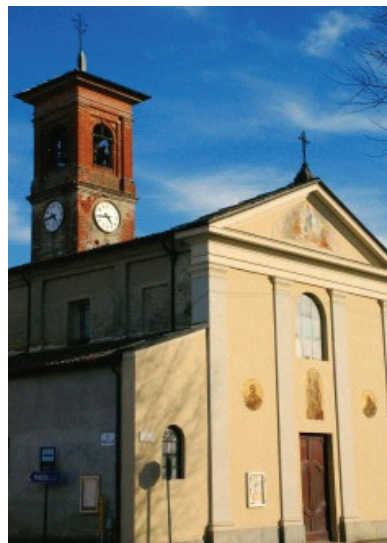
La chiesa San Marco di Baudenasca

Nel mese di novembre sono iniziati, con scadenza quindicinale (il venerdì alle ore 21), gli incontri Biblici in parrocchia